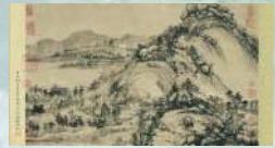
The first part of the Dwelling in the Fuchun Mountains , titled The Remaining Mountain , Zhejiang Provincial Museum in Hangzhou